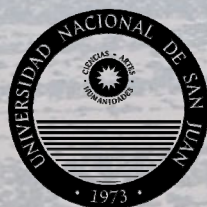
Universidad Nacional de San Juan