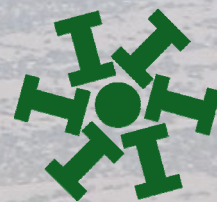
Facultad de Ingeniería - UNSJ